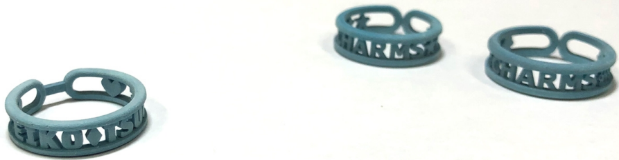
*開発で出力されたネームリング・タイプ・SSの試作群

しかし、新たなデジタルベースの技術が導入されたことで、ジュエリーのデザインを規則的で綺麗に揃えることが可能になります。